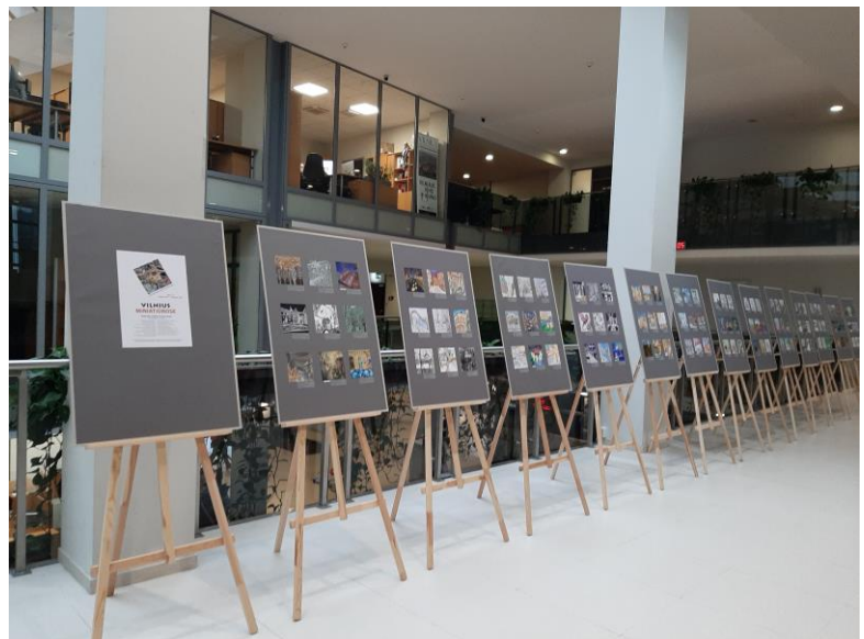
Parodos ekspozicija Vilniaus miesto savivaldybėje