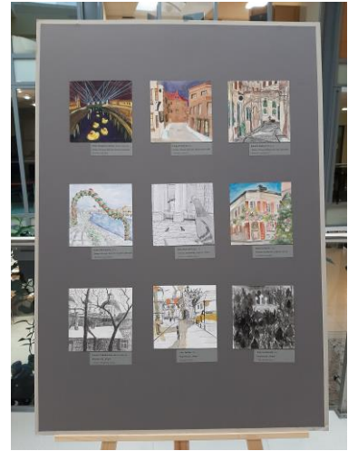
Parodos atidarymas Vilniaus miesto savivaldybėje